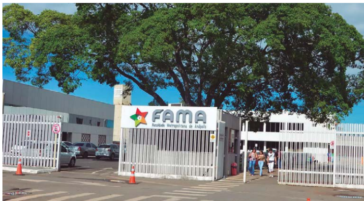
Colégios eleitorais estão localizados na Faculdade Fama (Zona 003), na Faculdade Fibra (Zona 101) e também na UniEvangélica (Zona 144)

Zona 003 - Faculdade Fama (Avenida Fernando Costa, 49, Vila Jaiara) / Zona 141 - Faculdade Fibra (BR 060/153, km 97, São João) / Zona 144 - UniEvangélica (Avenida Universitária, Km 3,5, Cidade Universitária)