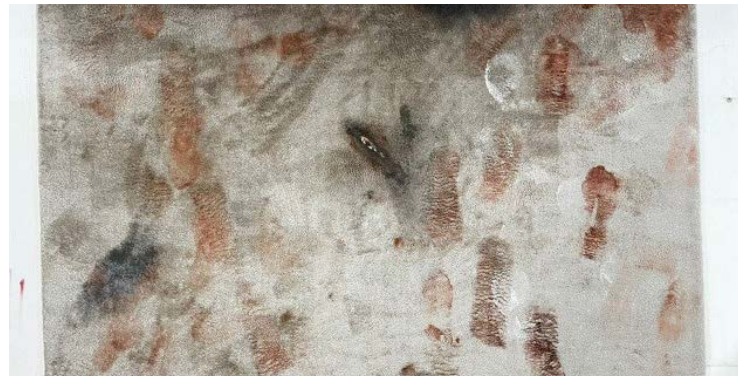
Siron teve ideia de obra ao ver destruição pelo noticiário

Trabalho faz alusão à data em que sede do Supremo foi vandalizada por extremistas