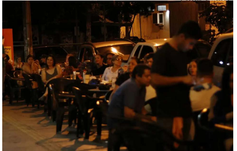
Boêmia clássica: espaço faz sucesso com boas opções etílicas e gastronômicas