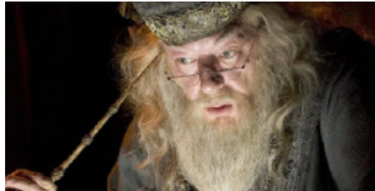
Na carreira, Michael Gambon recebeu quatro BAFTAs de Melhor Ator