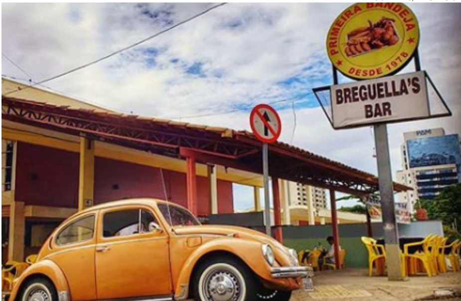
Setor Oeste: filial do bairro funciona desde 1978