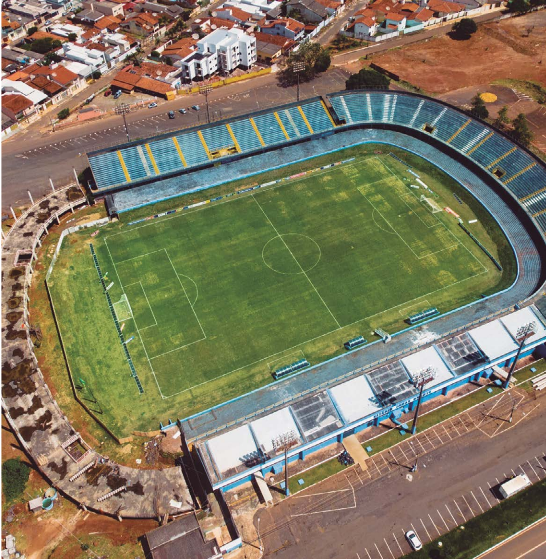
Informações iniciais dão conta que Estádio Jonas Duarte chega a custar R$ 2 milhões aos cofres da Prefeitura