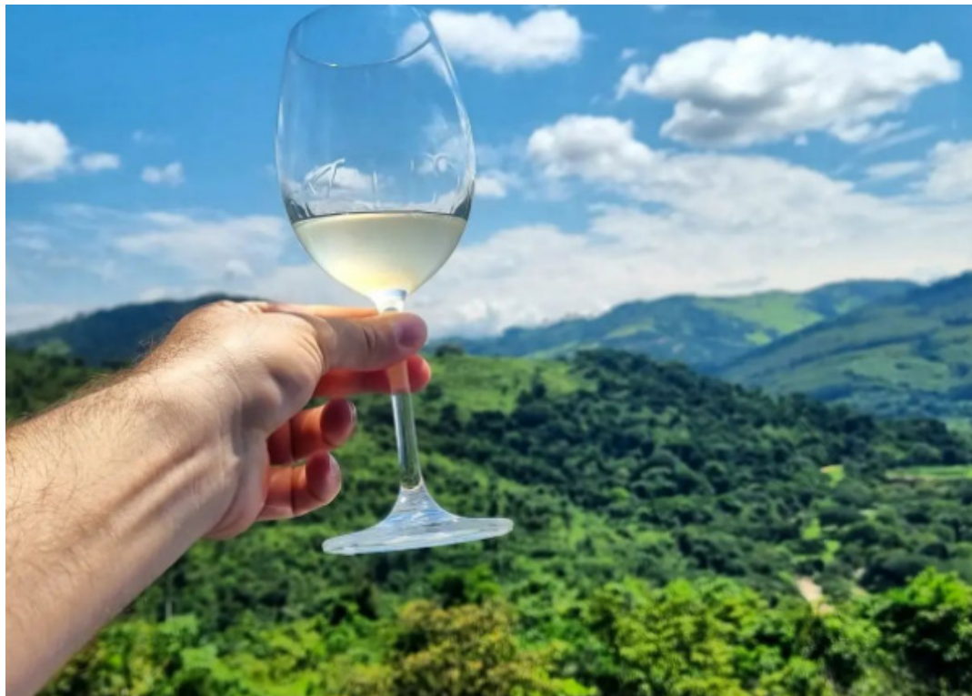
Sauvignon Blanc: é vinho jovem e fresco, com corpo médio

A paixão pelo vinho leva muitos enófilos a sonharem em ter um negócio próprio no setor. O crescimento do mercado nos últimos anos tem encorajado os winelovers a empreender no mundo do vinho, criando sua própria vinícola. Além do constatado crescimento do consumo, grandes players mundiais estão apostando no Brasil.