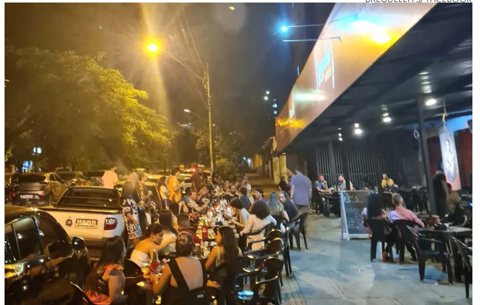
Espaço do povo: bar se notabiliza por rodas de samba com músicos conhecidos