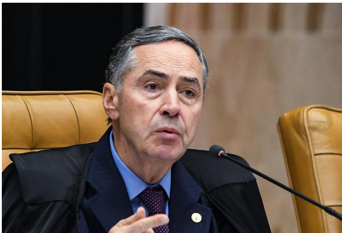
Luís Roberto Barroso: poderes devem atuar de forma harmônica com independência

Em meio ao embate entre STF e Congresso - com a divergência sobre temas como o marco temporal, aborto e a descriminalização das drogas - Gilmar aconselhou: “Vivemos um tempo que requer compromisso inequívoco dos três