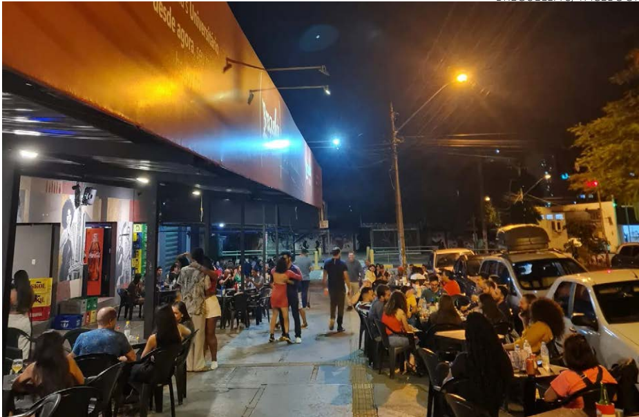
Samba no pé: público deixa cadeiras para arriscar passos de dança