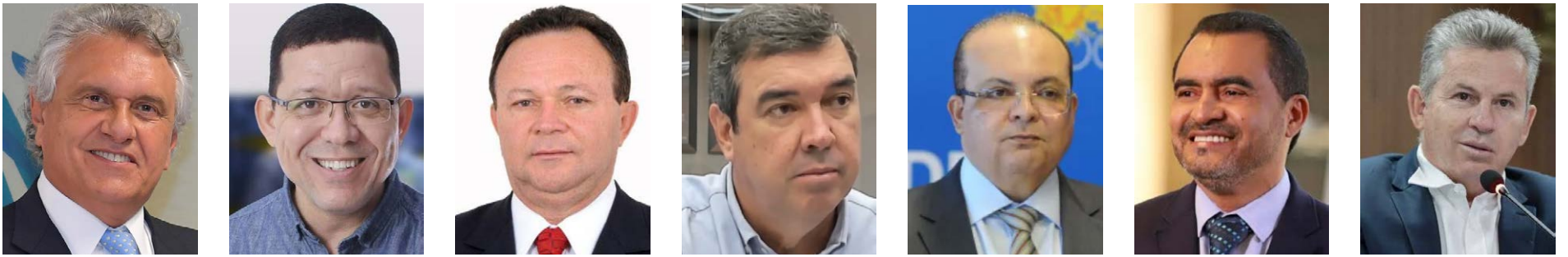
Ronaldo Caiado (Goiás), Marcos Rocha (Rondônia), Carlos Brandão (Maranhão), Eduardo Riedel (Mato Grosso do Sul), Ibaneis Rocha (Distrito Federal), Wanderlei Barbosa (Tocantins) e Mauro Mendes (Mato Grosso) participam do encontro em Rio Quente

Anfitrião do Fórum de Governadores do Brasil Central, Ronaldo Caiado propôs união do grupo para fortalecer estados. Encontro terá presença de sete unidades da federação