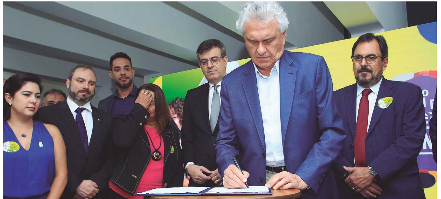
Ronaldo Caiado assina o pacto nacional e diz que Goiás vai bater a meta de vacinação, atingindo os índices preconizados pelo Ministério da Saúde

Algumas instituições se comprometeram em, posteriormente, assinar o termo, casos da Defensoria Pública da União em Goiás, a Prefeitura de Goiânia, a Pontifí-