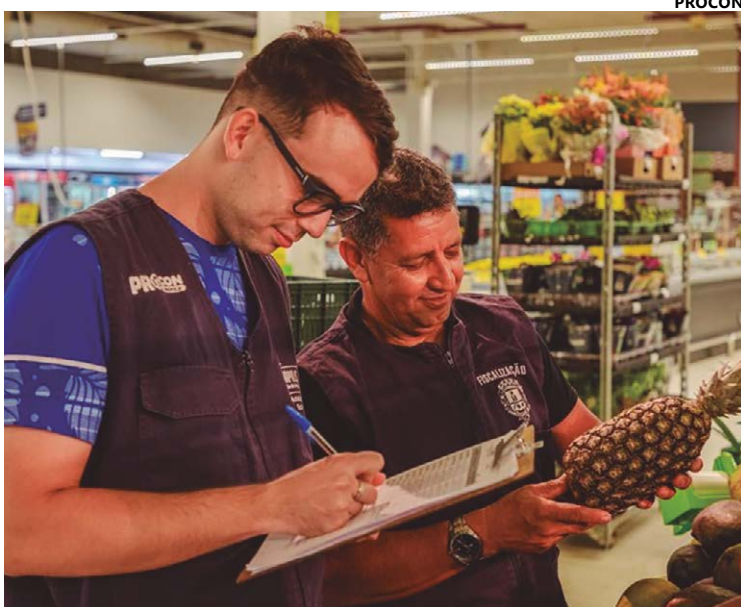
Fiscais do Procon, no levantamento de preços de mais de 30 produtos

Levantamento realizado pelo Procon Anápolis mostra quais são os locais onde os produtos estão mais baratos